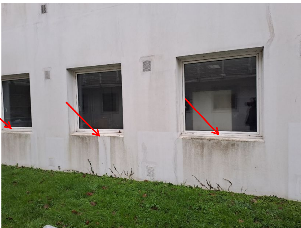
- 09 Fourniture et pose d'appuis de fenêtre