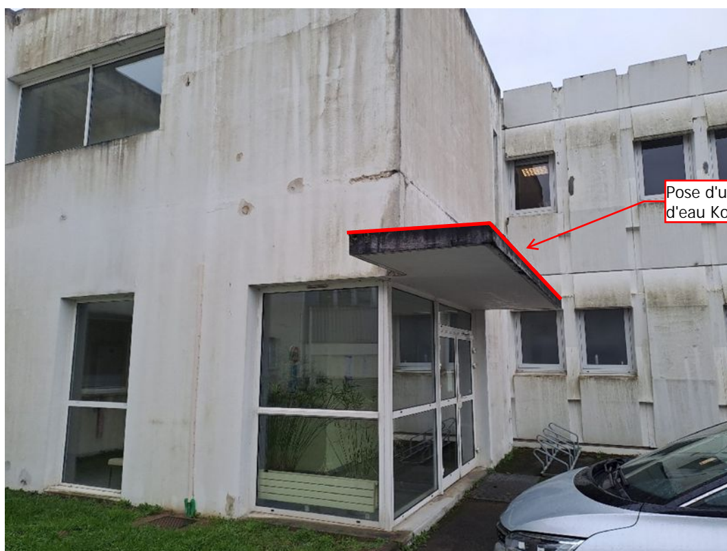
- 13 Système d'étanchéité liquide sur casquette