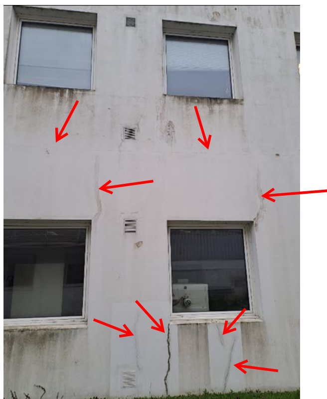
- 05 Traitement des fissures au mortier fibré