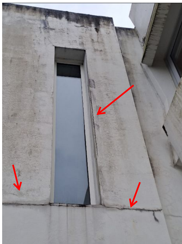
- 06 Traitement des fissures au mortier fibré