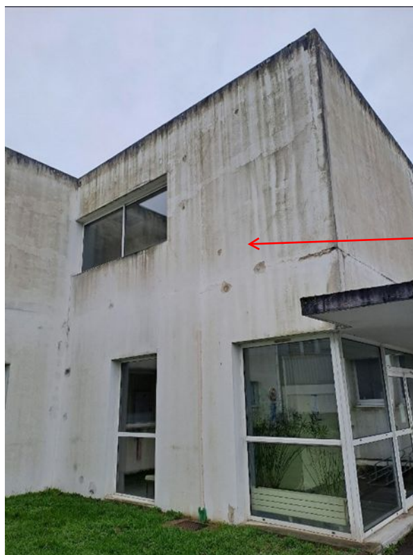
- 01 Lavage haute pression et antimousse

Traitement des divers éclats sur les façades