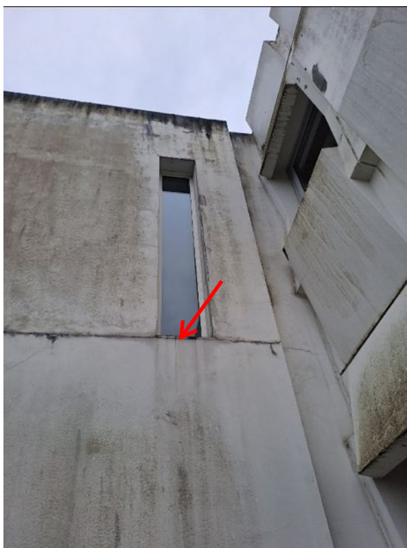
- 10 Fourniture et pose d'appuis de fenêtre