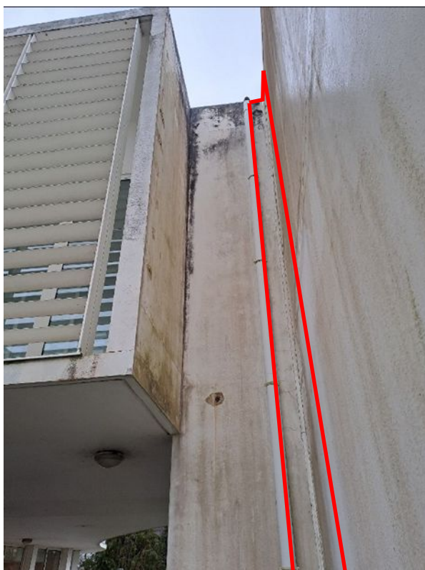
- 08 Traitement du joint de dilatation