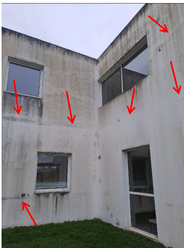
- 03 Traitement des fissures au mortier fibré

Traitement de toutes les fissures des façades au mortier fibré