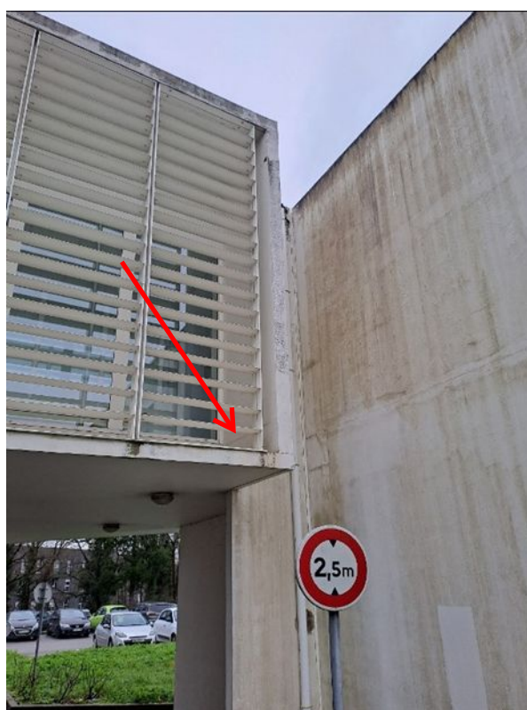
- 11 Pose d'une équerre resine patio supérieur