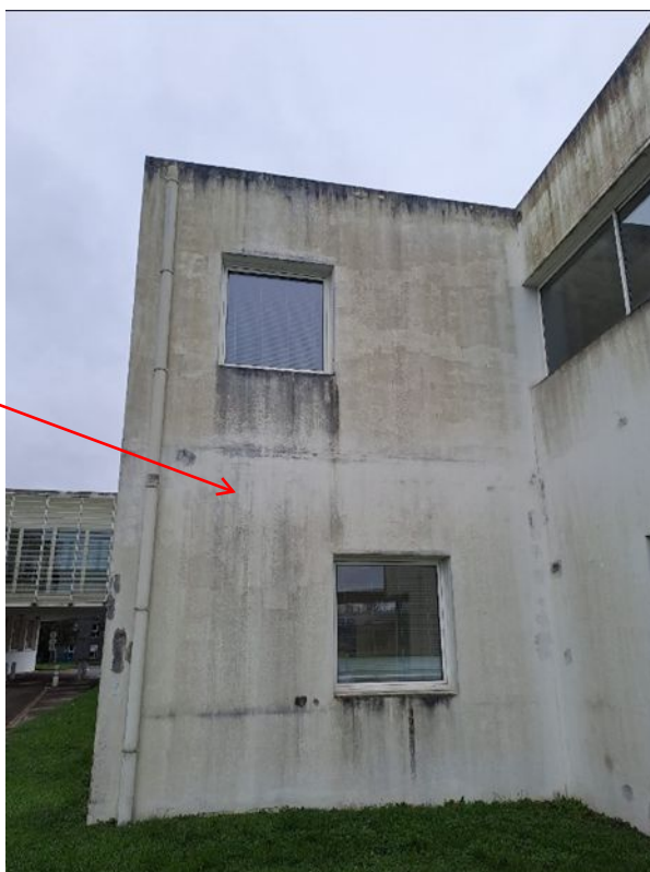
- 04 Traitement des fissures au mortier fibré

Traitement de toutes les fissures des façades au mortier fibré