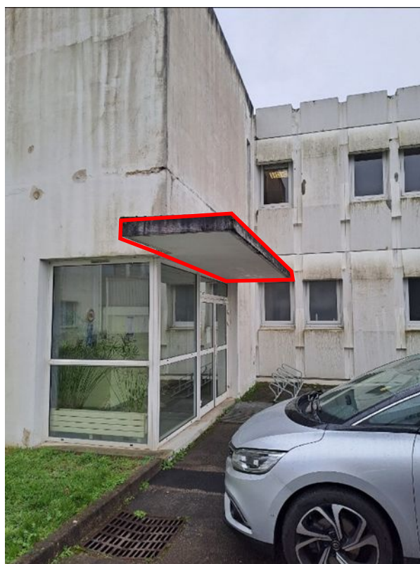
- 12 Système d'étanchéité liquide sur casquette